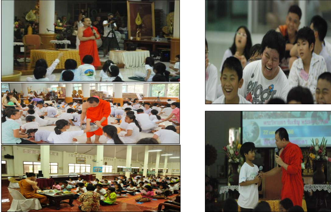
ภาพกิจกรรมโครงการเผยแผ่ พระพุทธศาสนาประกอบการเรียนการสอนรายวิชาธรรมนิเทศ ของนิสิตชั้นปีที่ ๒ คณะมนุษยศาสตร์ มจร ชื่อโครงการ "ล้อมกรอบคร่ำด้วยรั้วธรรม"

โครงการในรายวิชาภาษาไทยที่นิสิตสนใจ ต้องสามารถ อธิบายทฤษฎีที่นำมาใช้ในการทำโครงการได้อย่างชัดเจน เกิดประโยชน์ และมีขอบเขตโครงการที่สามารถทำเสร็จได้ภายในระยะเวลาที่กำหนด เป็นโครงการที่มีมาตรฐานผลการเรียนรู้ซึ่งมีจุดมุ่งหมายให้นิสิตสามารถทำงานเป็นทีมร่วมกันได้ มีความเชี่ยวชาญในการใช้เครื่องมือ หรือโปรแกรมในการทำโครงการ และเป็นโครงการที่สามารถเป็นต้นแบบในการพัฒนาต่อยอดการเรียนรู้ได้อย่างบูรณาการ