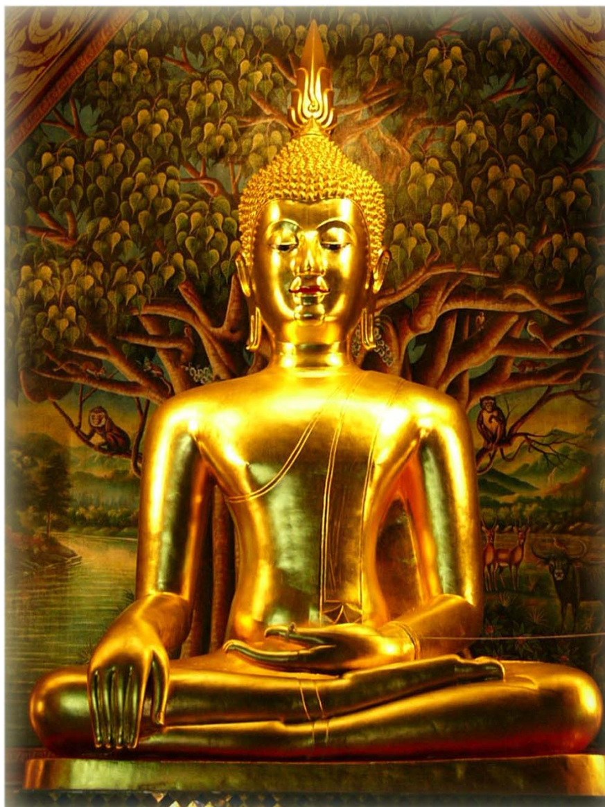
ภาพพระเจ้าเก้าตื้อหลังการบูรณะปิดทอง (ภาพหลัง วันที่ ๔ กุมภาพันธ์ พ.ศ. ๒๕๔๐)