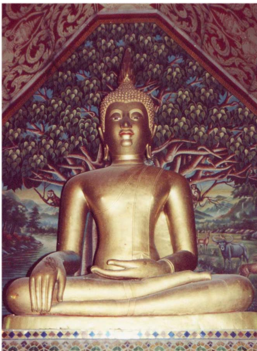
ภาพพระเจ้าแก้วตื้อก่อนการบูรณะปิดทองใหม่ (ภาพก่อนวันที่ ๑๑ มกราคม พ.ศ. ๒๕๔๐)