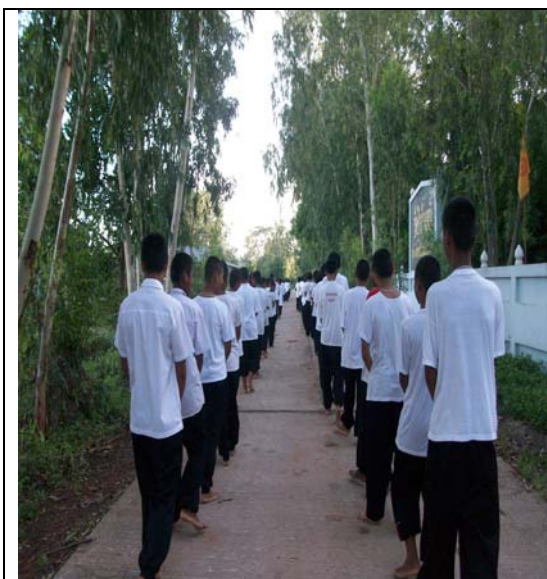
ฝึกเดินจงกรม