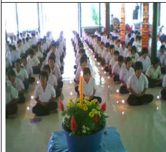
กิจกรรมแสงเทียนแด่แม่