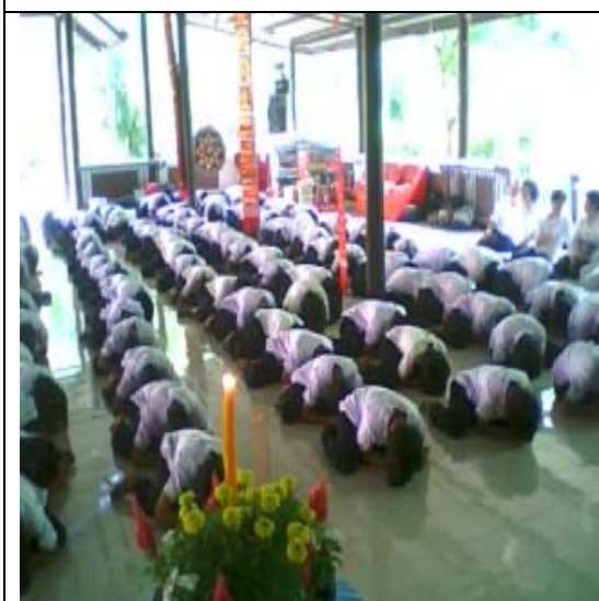
กราบขอขมาพ่อแม่