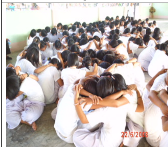
กิจกรรมเพื่อน