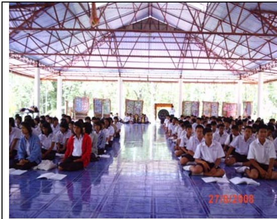
ปฐมนิเทศ