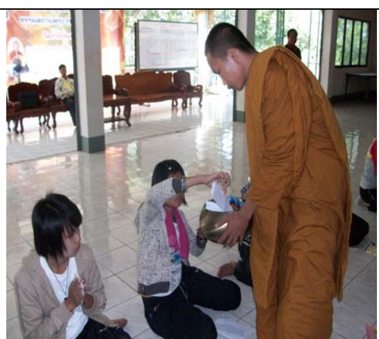
พระอาจารย์รับบิณฑบาตกิเลส