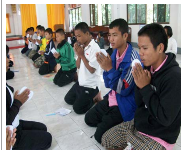
อธิษฐานจิตเพื่อชีวิตใหม่ (ตักบาตรกิเลส)