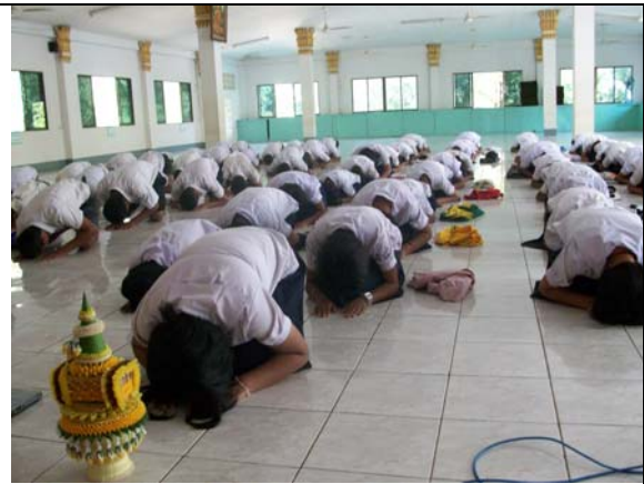
มอบตัวเป็นศิษย์