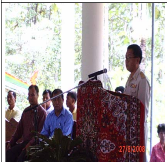
ประธานกล่าวเปิดงาน