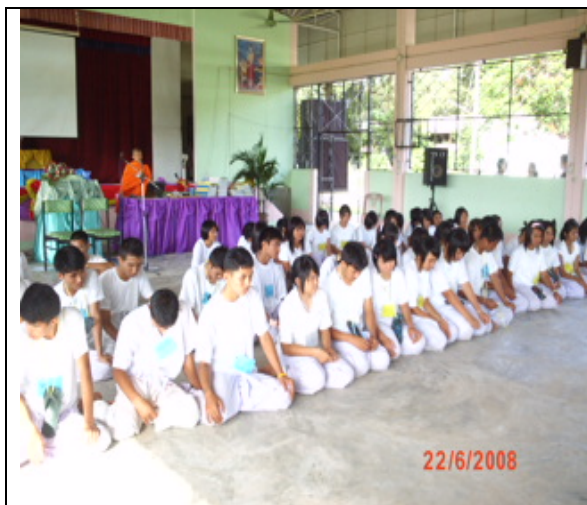
กิจกรรมรู้จักสามัคคี