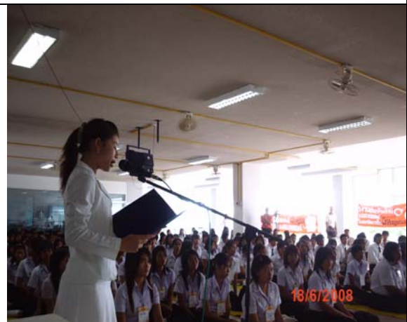
กล่าวรายงานต่อประธาน