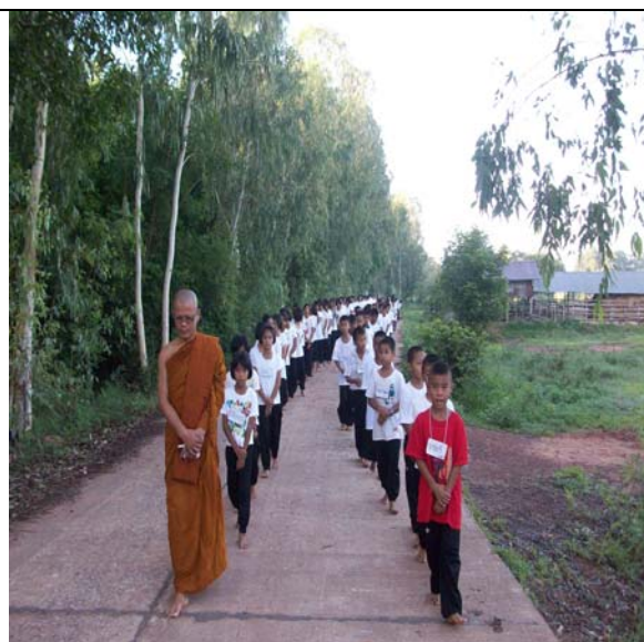
ฝึกเดินจงกรม