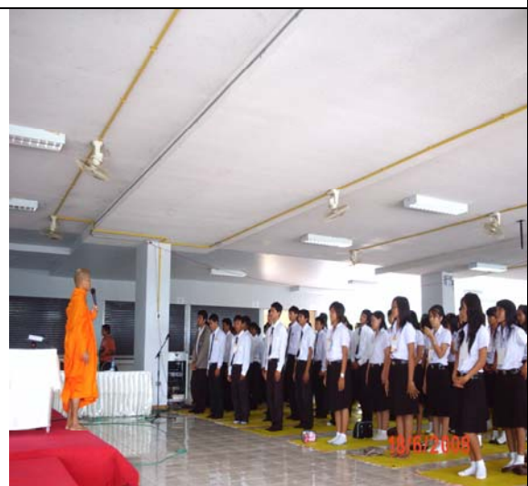
พระอาจารย์จัดระเบียบแถว