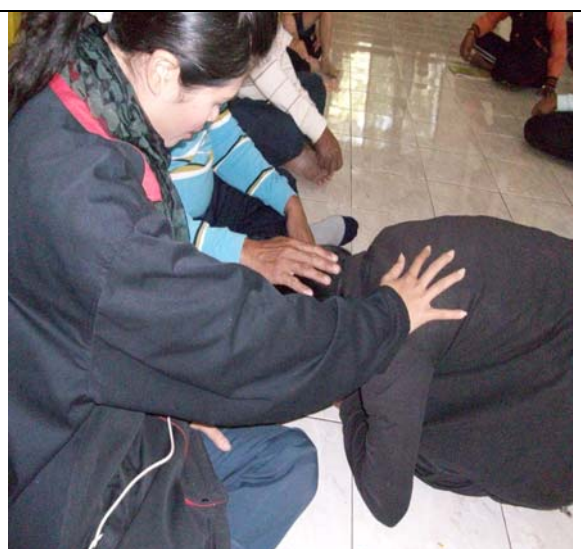
กราบขอขมาคุณครู