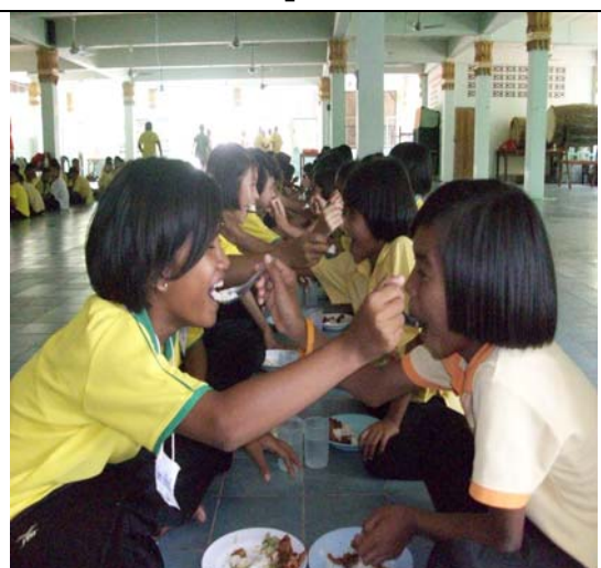
มิตรภาพของกิจกรรมเพื่อน