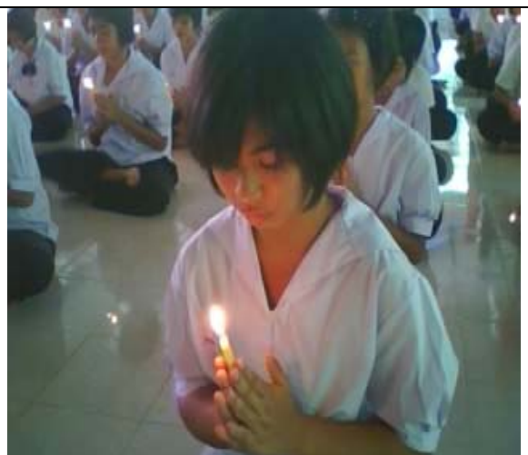
กิจกรรมแสงเทียนแด่แม่