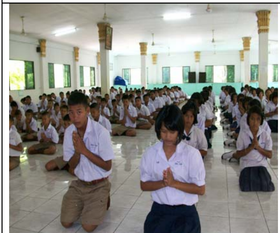
กล่าวคำปฏิญาณตน