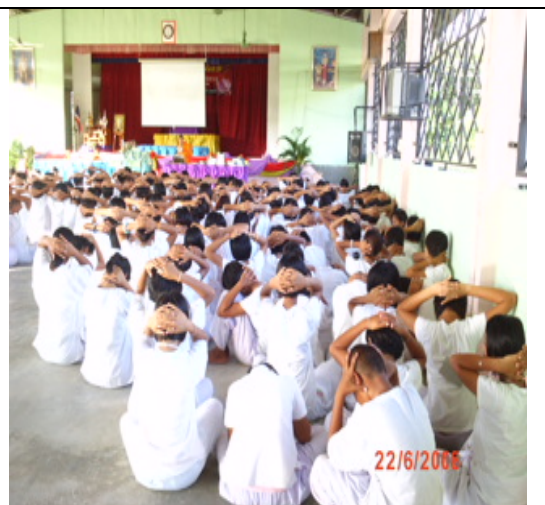
กิจกรรมรู้รับผิดชอบ