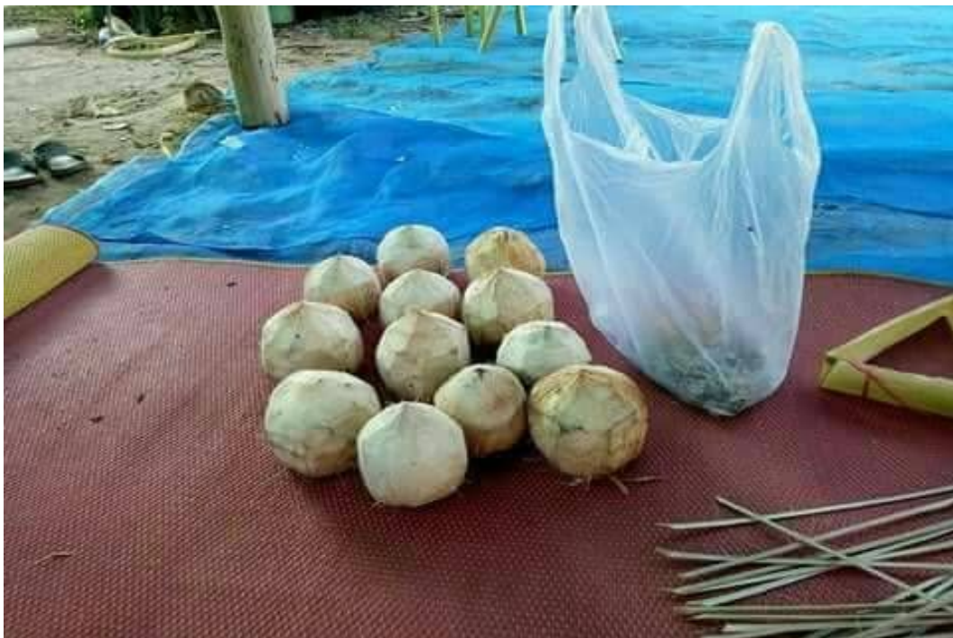
ภาพอุปกรณ์ (ลูกมะพร้าว) ใช้สำหรับปักไม้ไผ่