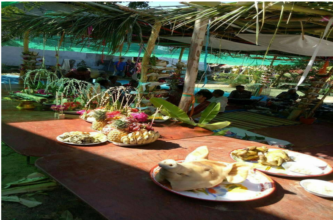
ภาพการเตรียมเครื่องเซ่นไหว้ในพิธีกรรม