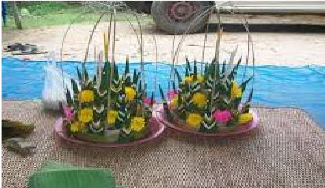
ภาพบายศรีชาม