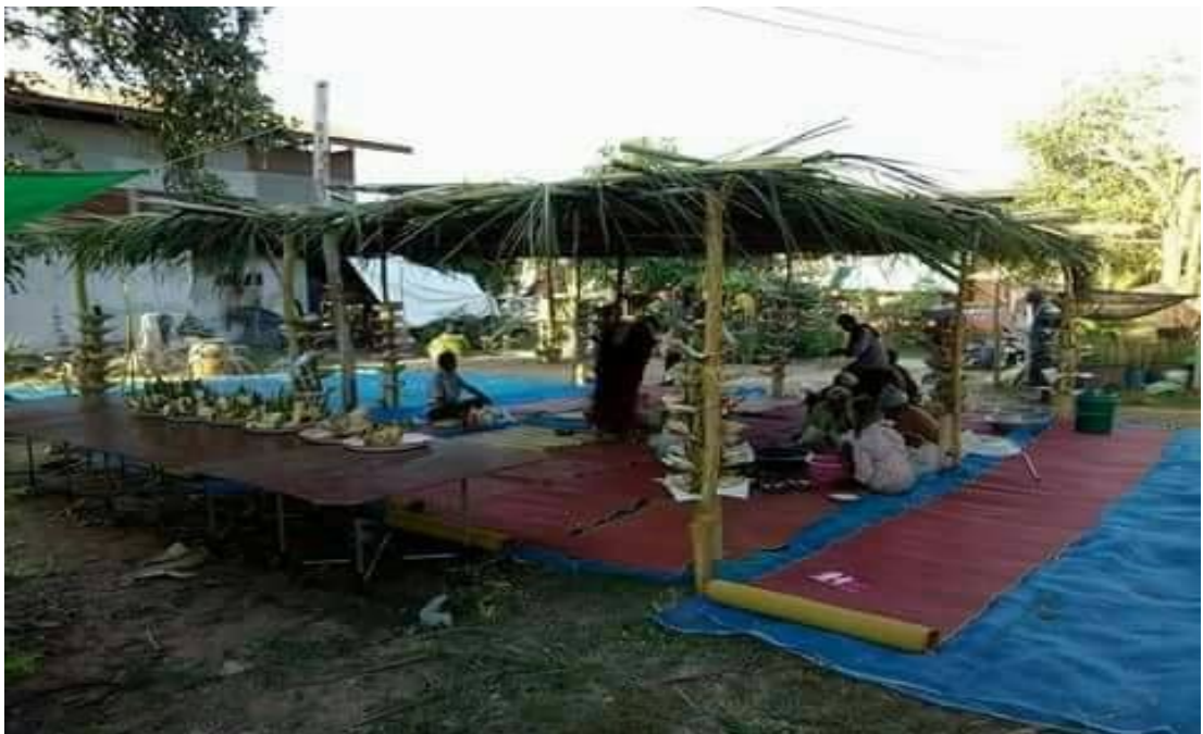
ภาพการจัดเตรียมสถานที่พิธีในโรง