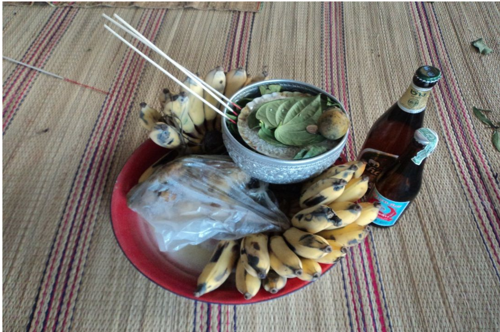
ภาพเครื่องเซ่นดนตรี