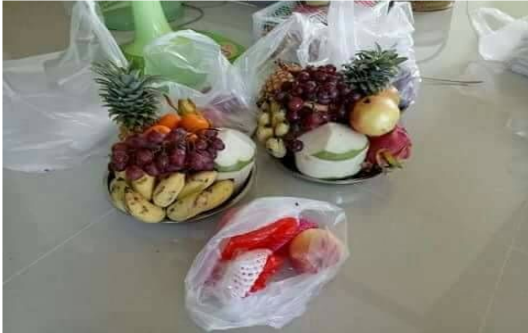
ภาพผลไม้ต่าง ๆ ที่ใช้ในการเซ่นไหว้