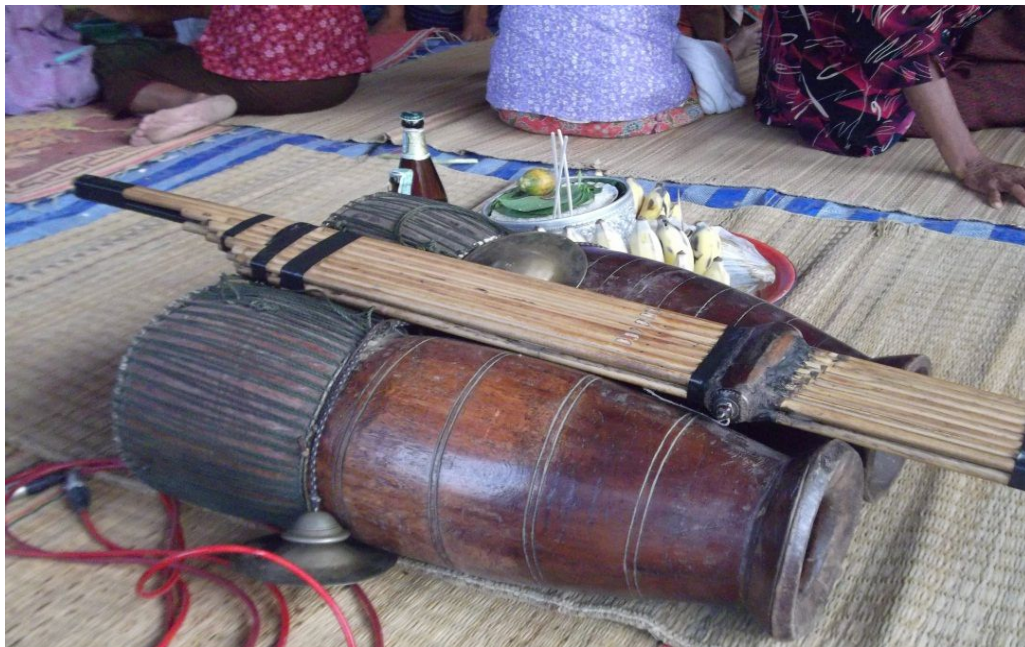
ภาพการเซ่นเครื่องดนตรี