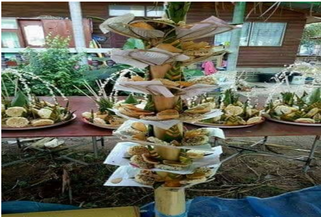
ภาพการจัดเตรียมบายศรีต้น / บายศรีเถาด