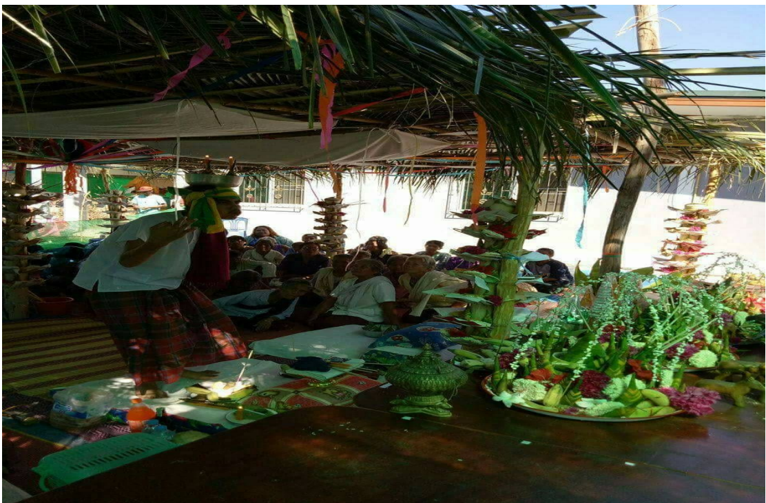
ภาพร่างทรงมะมั่วตกำลังทำพิธีกร