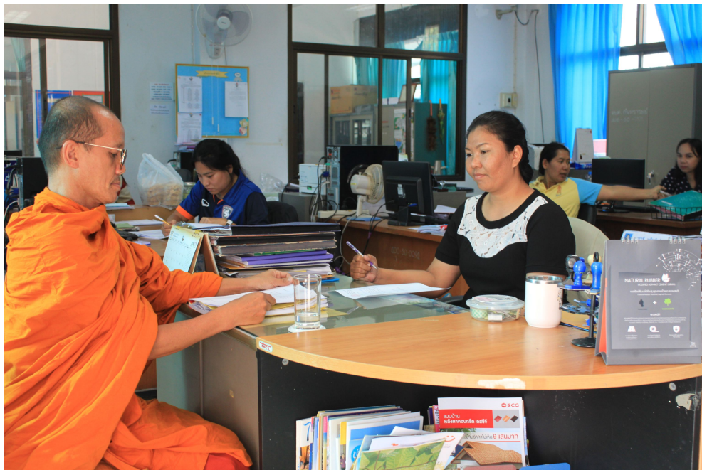
ภาพเจ้าหน้าที่ องค์การบริหารส่วนตำบลกันทรารมย์ กำลังให้ข้อมูลด้านเอกสาร (วันที่ ๒๖ กุมภาพันธ์ พ.ศ.๒๕๖๑)