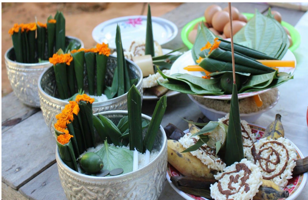
ภาพกรวยแกว กรวยข้าวต้ม