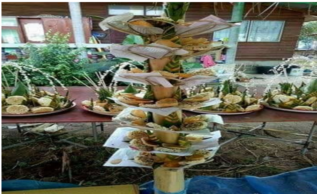
ภาพบายศรีเสา