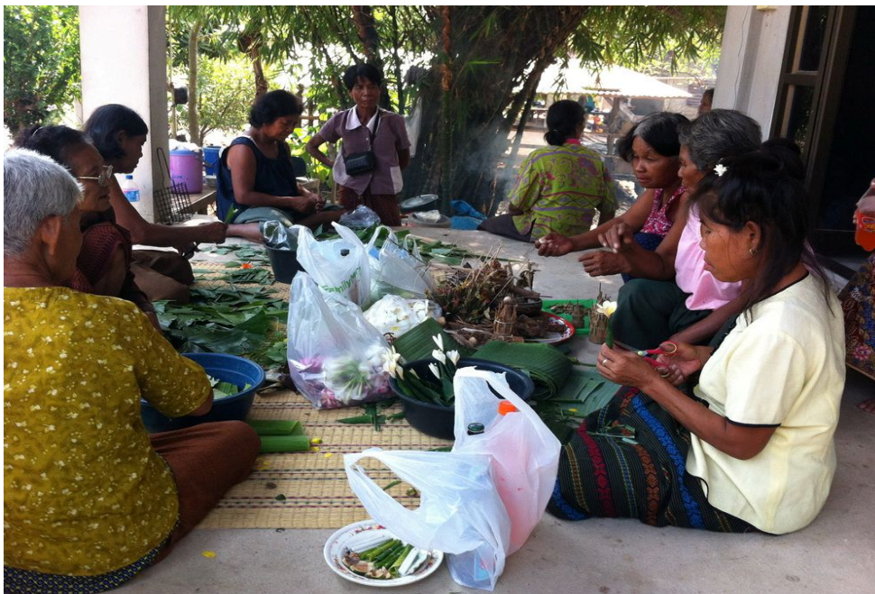
ภาพชาวบ้านช่วยกันห่อข้าวต้มมัด ข้าวต้มกรวย เพื่อในพิธีกรรมมะม่วง