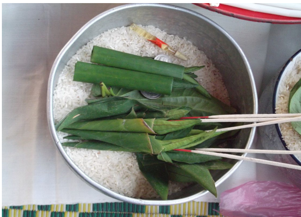
ภาพชั้นข้าวสาร (ปเต็ล-งกอ) ข้าวสาร