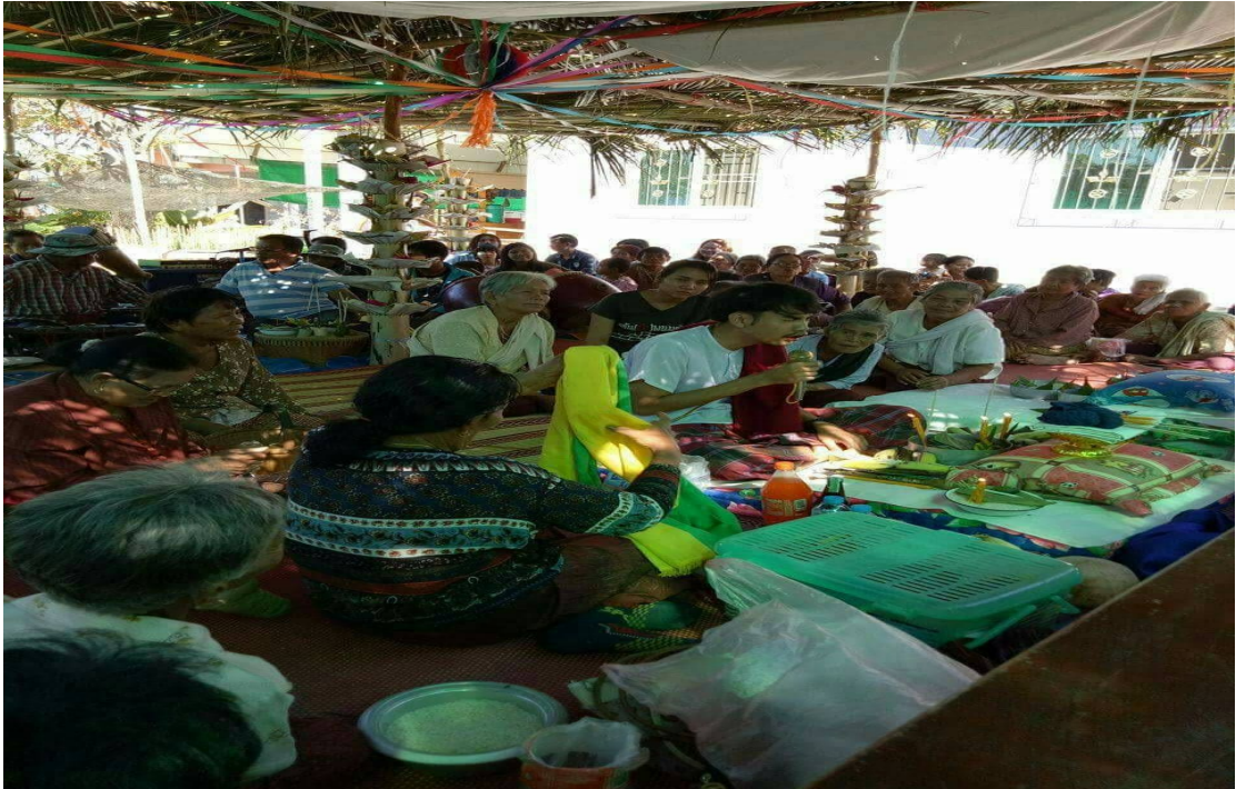
ภาพการเข้าทรงมะมั่วต