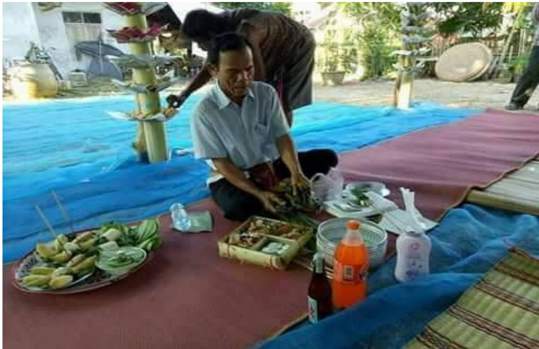
ภาพอาจารย์ในพิธีกำลังจัดเตรียมบายศรี