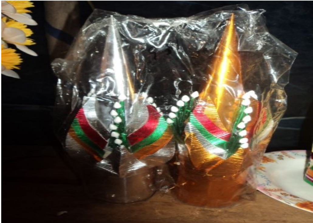
การเข้าทรงของครุมีวัด