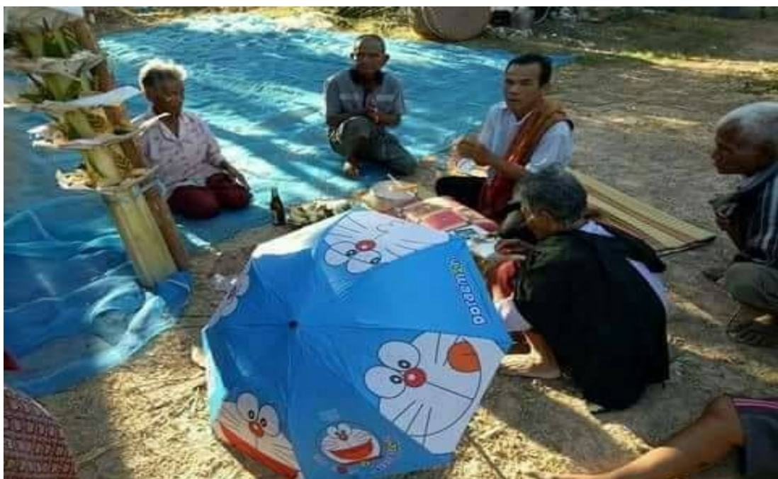
ภาพอาจารย์ในพิธีกำลังจัดเตรียมความพร้อมพิธี