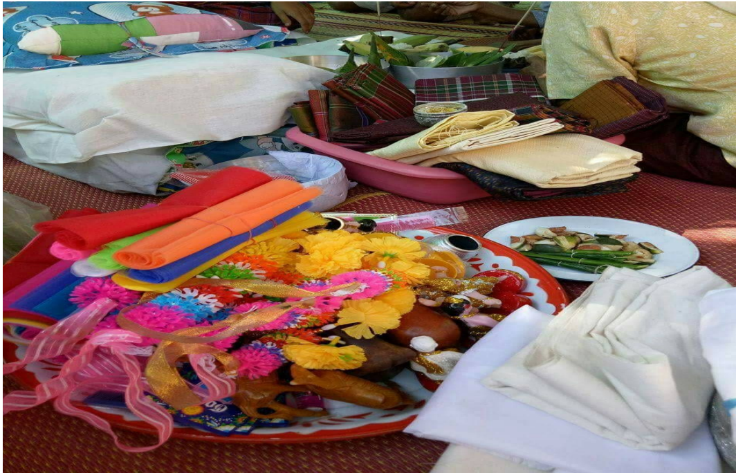
ภาพอุปกรณ์ (ผ้าสี) ใช้ในพิธี