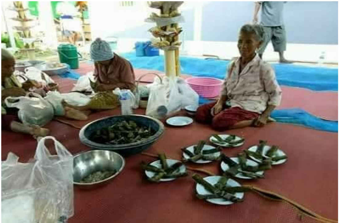
ภาพการจัดเตรียมบายศรีปากชาม